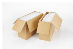
①ダンボール箱でお届けします

一般的にベッドマットレスは大物配送となりますが、エアウィーヴのベッドマットレスは画期的な3分割構造のため、宅配便でのお届けが可能です。組み立ても簡単で、一人でもスムーズに設置できます。