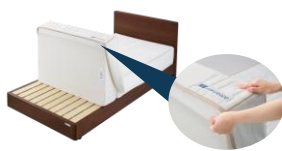
③脚側のブロックに底面の返し生地を引っかけます