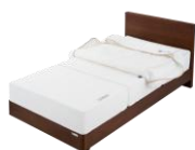
②中材のブロック3つを並べ、頭側からアウトターカバーを被せます