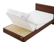
④ブロックをゆっくり倒します